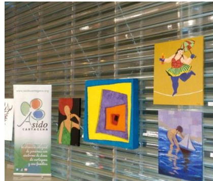
EXPOSICIÓN EN EL BATELL