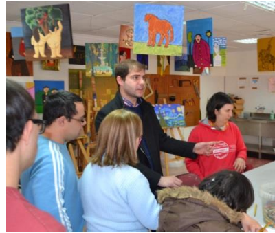
Concejal de Deportes