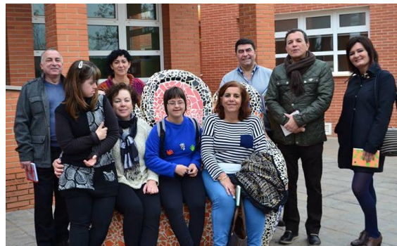
Concejalía de Servicios Sociales