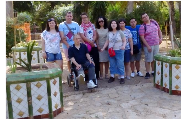
Huerto de las Bolas