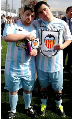
CAMPEONATO DE FUTBOL ADAPTADO