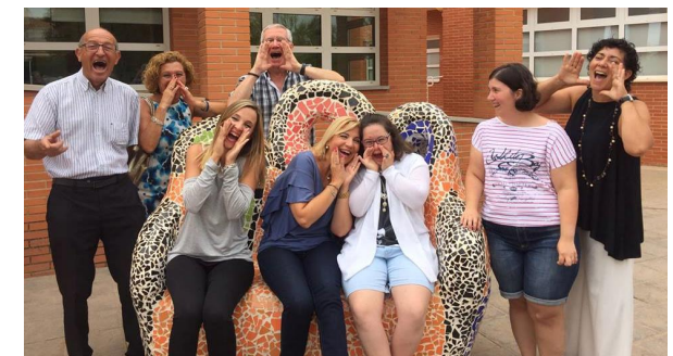
Consejera de Política Social: Violante Tomás