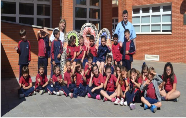
CEIP NARVAL: 108 Alumnos