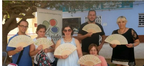
FIESTAS DE SANTA ANA