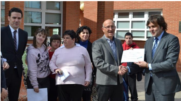
COEC y El Corte Inglés