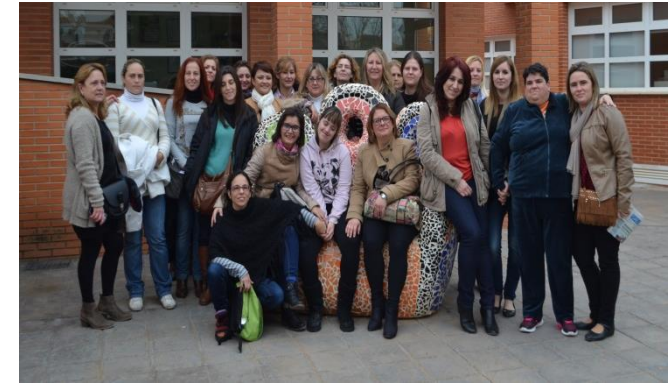
Atención Sociosanitaria ADLE