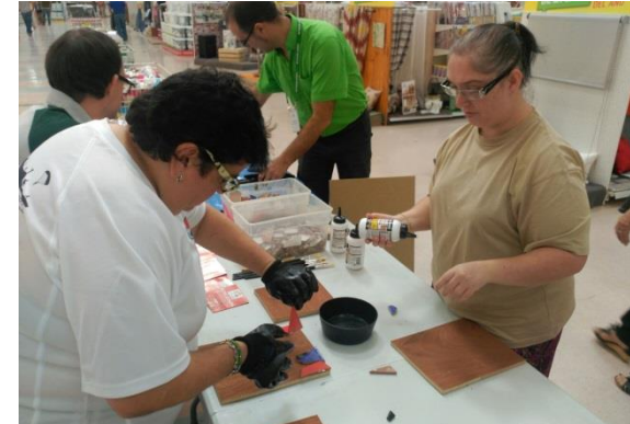
FIESTA DE LA CASA DE LEROY MERLIN